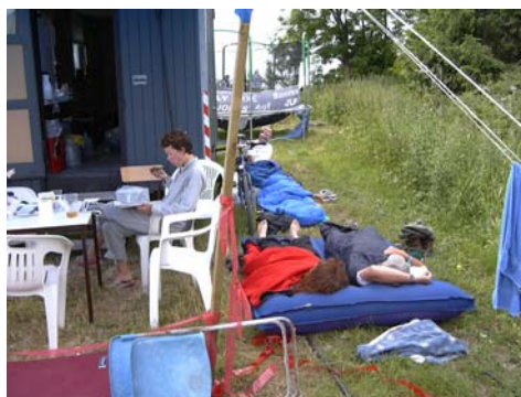
Ro i lejeren....