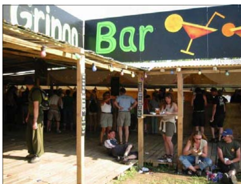
Gringo bar jubiiiiii....