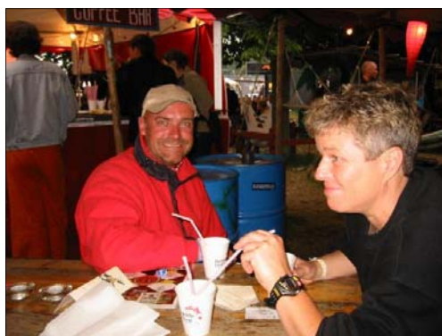
På kaffe BAR....