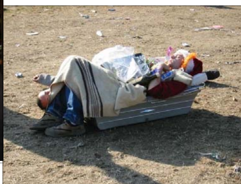
Godnat og sov godt....